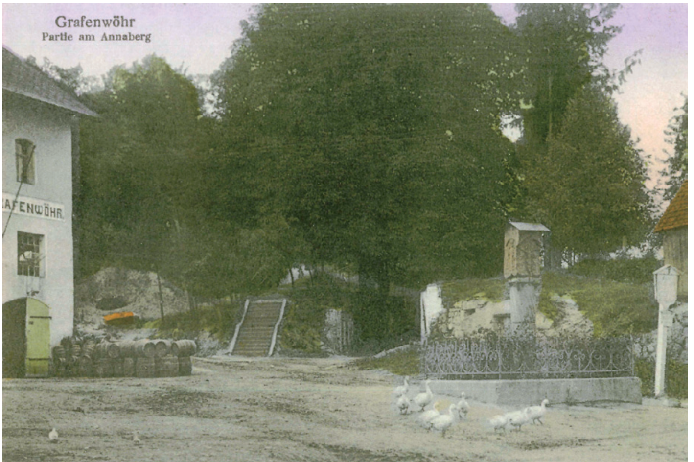
Früherer Standort der Pestsäule am Aufstieg zum Annaberg

Am 20. Januar begeht die Stadt ihren Gelübdefeiertag zum Stadtpatron, dem Heiligen Sebastian. Die Kolpingfamilie lädt wie alle Jahre gemeinsam mit der Stadt und der Pfarrei zur Feier dieses Tages ein. Nach dem Gottesdienst versammelt sich die Gemeinde auf dem Marktplatz um die Pestsäule. 1982 wurde mit der Renovierung des Marktplatzes die Pestsäule von ihrem alten Standort in der kleinen Anlage nach dem Treppenaufgang