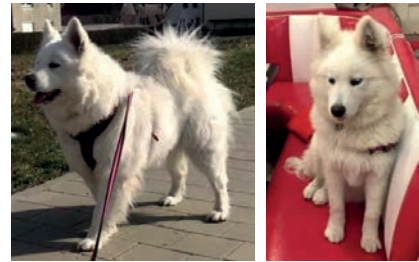
Hündin MEY MEY