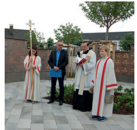
Segnung der 2. Urnenwand mit Vorplatz 2017