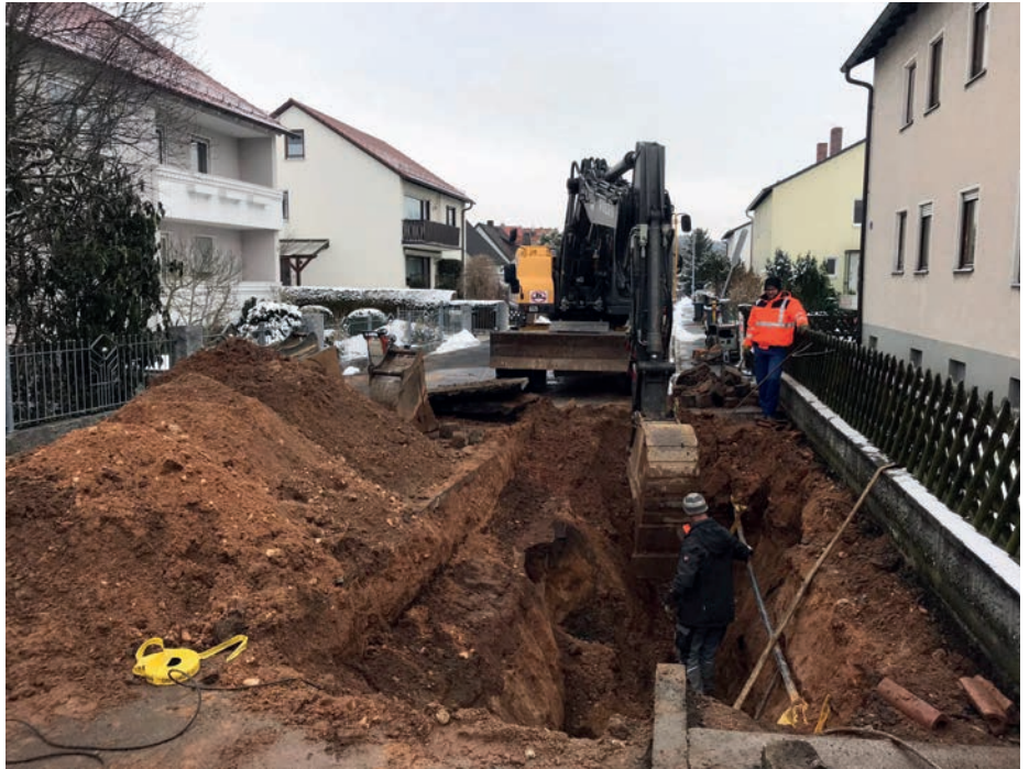
Mitarbeiter der Fa. Kraus bei der Behebung des Schadens

Er erklärte noch den Ablauf einer Reparatur. Sobald ein Rohrbruch entdeckt wird, wird der Wasseraustritt durch eine Sperrung der Leitung gestoppt. Die Stadtwerke beauftragen dann örtliche Baufirmen mit dem Ausgraben der Leckage-Stelle. Die richtige Stelle zu finden, sei nicht immer einfach, da der Wasseraustritt an der Oberfläche nicht punktgenau mit dem Leck am Rohr zusammenfalle. Die Differenz könne schon mal einige Meter betragen.