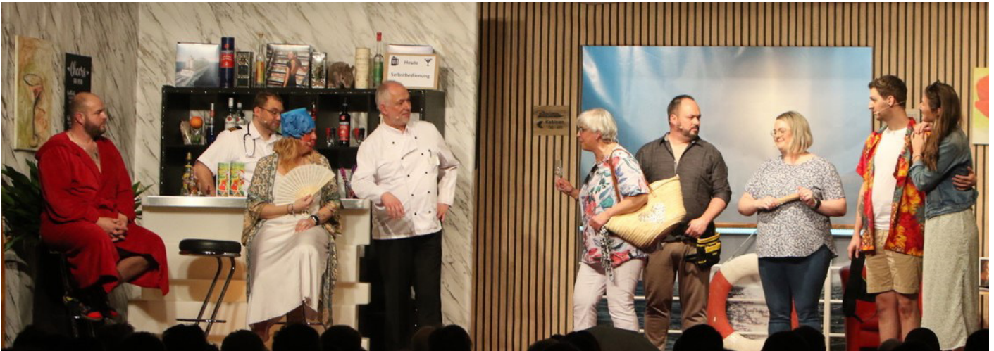
„Gürteltiere sind sexy!“ hieß am ersten Januarwochenende viermal bei der Kath. Theatergruppe. Über 1.250 Besucher erlebten einen kurzweiligen Abend. Das Foto zeigt die Schlusszene der turbulenten Verwechslungskomödie von Autor Wolfgang Bräutigam